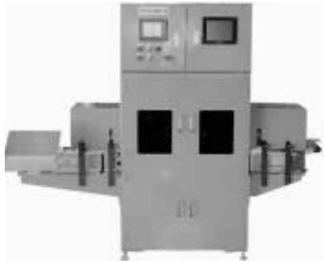
コンベヤ式カップ内面検査装置 Conveyor type cup inside inspection apparatus